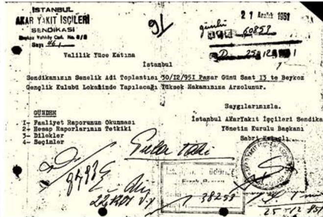
Genel Kurul bildirimi