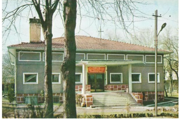
TÜRK-İŞ SENDİKACILIK KOLEJİ

"Bu İşçi Koleji'nin açılış merasiminde, bana, sizlere hitap etmek fırsatı bahşeden nazik davetinize teşekkürlerimi arz ederim. Türkiye'nin iktisadi kalkınmasında çok önemli rol oynadığına inandığım Türkiye İşçi Sendikaları Konfederasyonu Türk-İş'in, kendi gelişmesini sağlamak amacı ile yaptığı faaliyetlerin tanzim ve usulüne uygun bir şekilde tatbikinde gösterdiği gayretler bugün burada Çiftlik'te yaptığımız bu merasime ayrı bir özellik ve önem kazandırmaktadır. (...) Bizler, Amerika