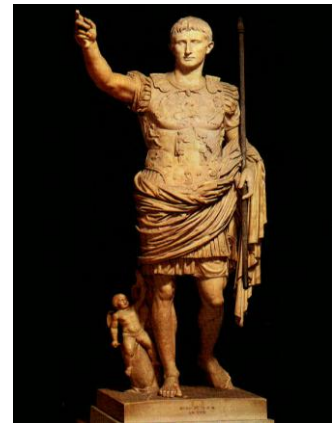
Gaius Octavius (Augustus)

Roma Barışı'nın önemli unsurlarından biri, Roma'daki patrisyenlerle plebler ve proletarii arasında barış sağlanmasıydı. Augustus bunu sağlayabilmek için Roma'nın yoksul özgür yurttaşlarına (pleblere ve proletariye) ucuz ve daha sonra da bedava buğday dağıttı. Mısır'dan Nil vadisinden getirilen bedava buğday, Roma'nın hakimiyeti altındaki bölgelerden gelen haracın bir bölümüyle finanse ediliyordu.