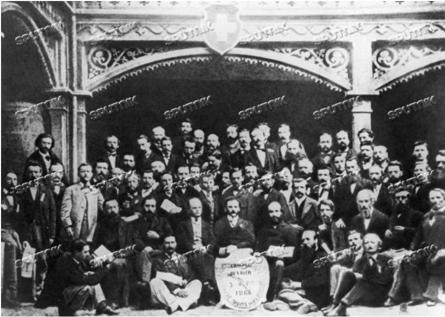
Birinci Enternasyonal Birinci Kongresi, Cenevre, 1866

Marx, 8 Eylül 1872 günü Amsterdam’da yaptığı konuşmada, Birinci Enternasyonal’in 2-7 Eylül 1872 günleri Lahey’de toplanan kongresini değerlendirdikten sonra şunları söylüyordu: “Hayır, Enternasyonal’den ayrılmayacağım ve yaşamımın geride kalan tümü, geçmişteki çabalarım gibi, tüm dünyanın her tarafında proletaryanın hakimiyetini bir gün getirecek olan (bundan emin olun!) toplumsal düşüncelerin zaferine adanmış olacaktır.” (Marx, Karl, “On the Hague Congress,” Marx-Engels, Collected Works , Vol.23, s.256)