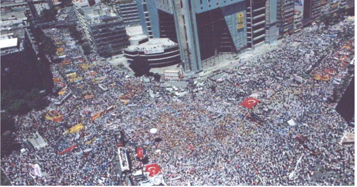
Emek Platformu'nun 24 Temmuz 1999 Ankara-Kızılay Mitingi

20 yıl önce Mart ayında Türkiye tarihinde ilk kez, işçi sınıfının tüm kesimleri bir araya gelerek, yaşanan ekonomik krizde Dünya Bankası aracılığıyla emperyalist güçlerin Türkiye'ye dayattıkları ekonomik politikaların alternatifi kapsamlı bir program hazırlayarak kamuoyuna sundu. Ben de, Türk-İş adına, bu programı hazırlayan komitede görev yapmışım. Türk-İş, Hak-İş, DİSK, KESK, Türkiye Kamu-Sen, Memur-Sen, Türkiye İşçi Emeklileri Derneği, Tüm İşçi Emeklileri Derneği, Tüm Bağ-Kur Emeklileri Derneği, TMMOB, Türk Dış Hekimleri Birliği, Türk Eczacılar Birliği, Türk Tabipleri Birliği, Türk Veteriner Hekimleri Birliği ve Türmob'dan oluşan EMEK PLATFORMU, 24-25 Mart 2001 günleri Ankara'da düzenlediği "Emek Politikaları Sempozyumu" sonrasında, 31 Mart 2001 günü yapılan Ekonomik ve Sosyal Konsey toplantısında, Emek Platformu Programı'nı Başbakan Bülent Ecevit'e sundu. Program, Emek Platformu'na bağlı örgütler tarafından binlerce basılarak üyelere dağıtıldı. Ancak nedense, bu programda ifade edilen son derece önemli ortak görüşler doğrultusunda daha sonraki yıllarda kararlı bir mücadele verilmedi.