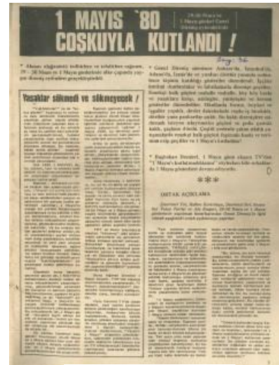
Devrimci Yol, Sayı 36