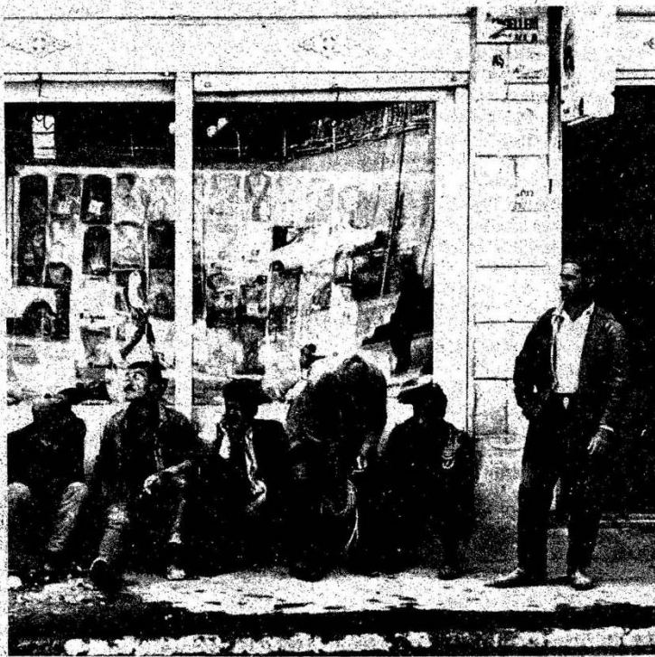
Yaşanan ekonomik bunalım işsizliği artırdı (Fotograf: Kemal Cengizkan, "İşsizler" - AFSAD)

el presi ile zil butonu basmak 15 kuruş (tanesi).